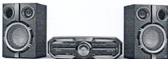
Aparelhagem e colunas HI-FI