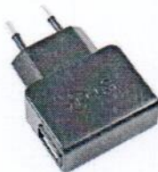
Transformador de telemóvel